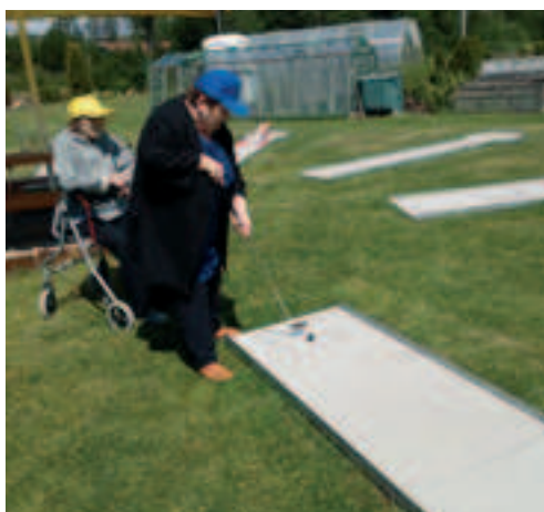
Minigolf v Malé Štáhli.