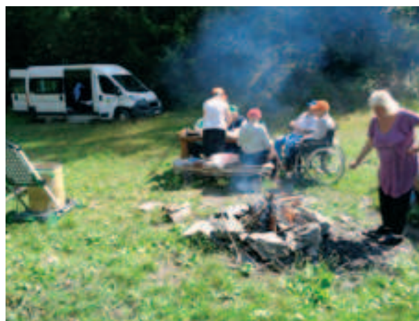
U jezírka v Brídličné.