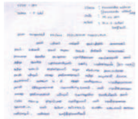
Část dopisu od dívky Selbi z Indie.

Všem zaměstnancům, kteří na Selbi přispívají, patří dík.