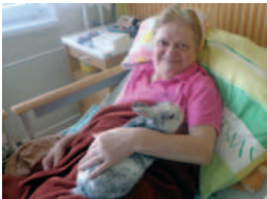
Králík zakrslý jmá hebkou srst.