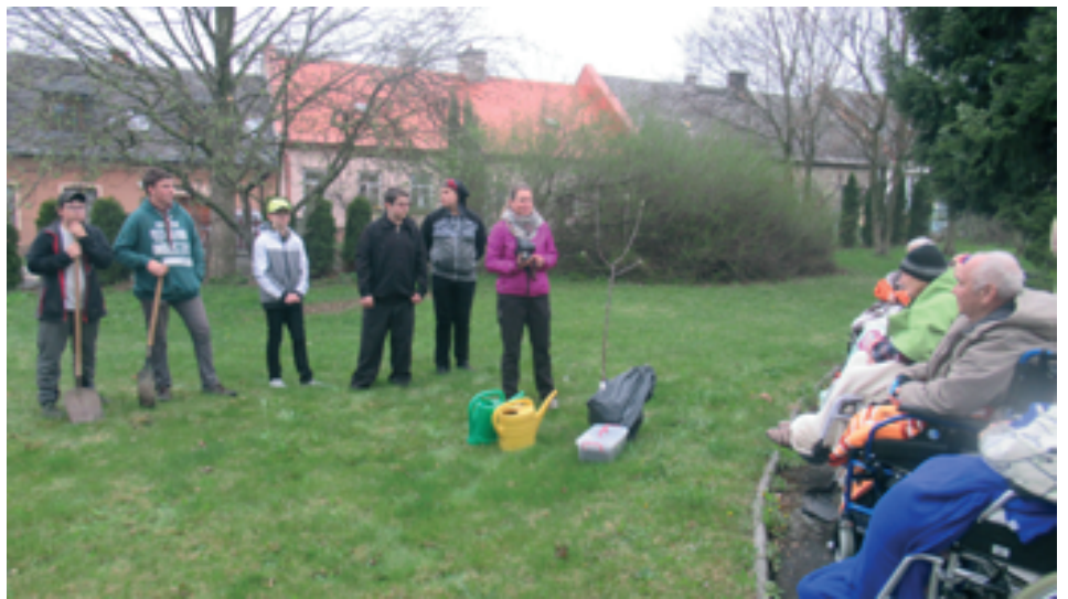
Senioři sledovali žáky při zasazování jabloně v zahradě centra.